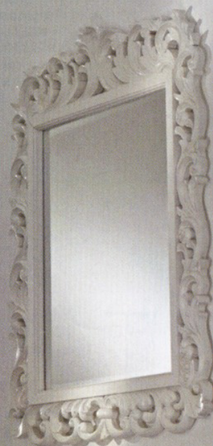
Babylon - Brian Rasmussen Design